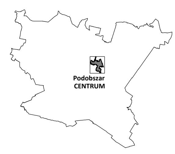
Załącznik 1 Podstawowe kierunki zmian funkcjonalno-przestrzennych podobszaru rewitalizacji CENTRUM